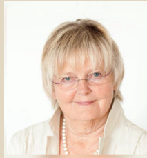
Telsche Ott Büsum Existenzgründung Geschäftsoptimierung